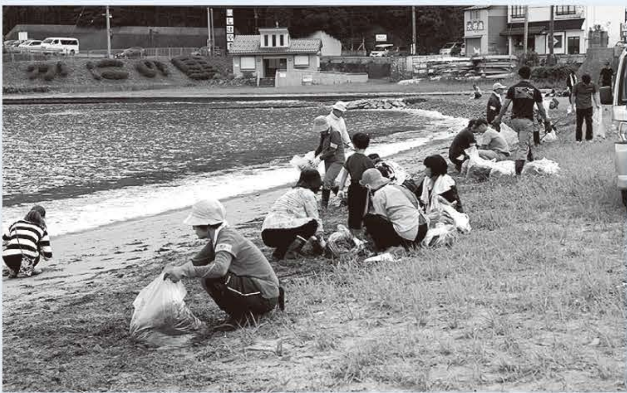
海山交流事業(海岸清掃・除雪活動)