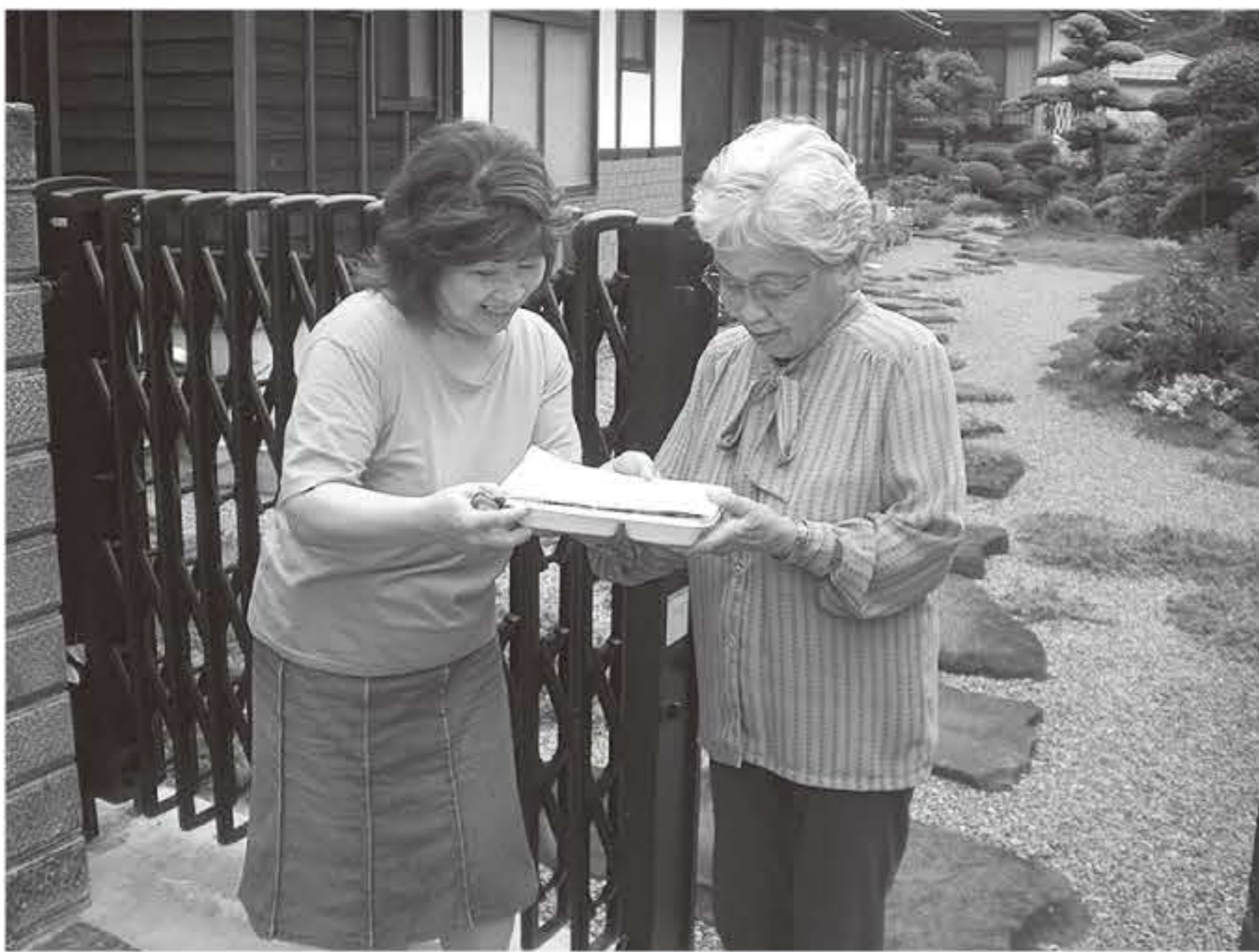
配食ボランティア