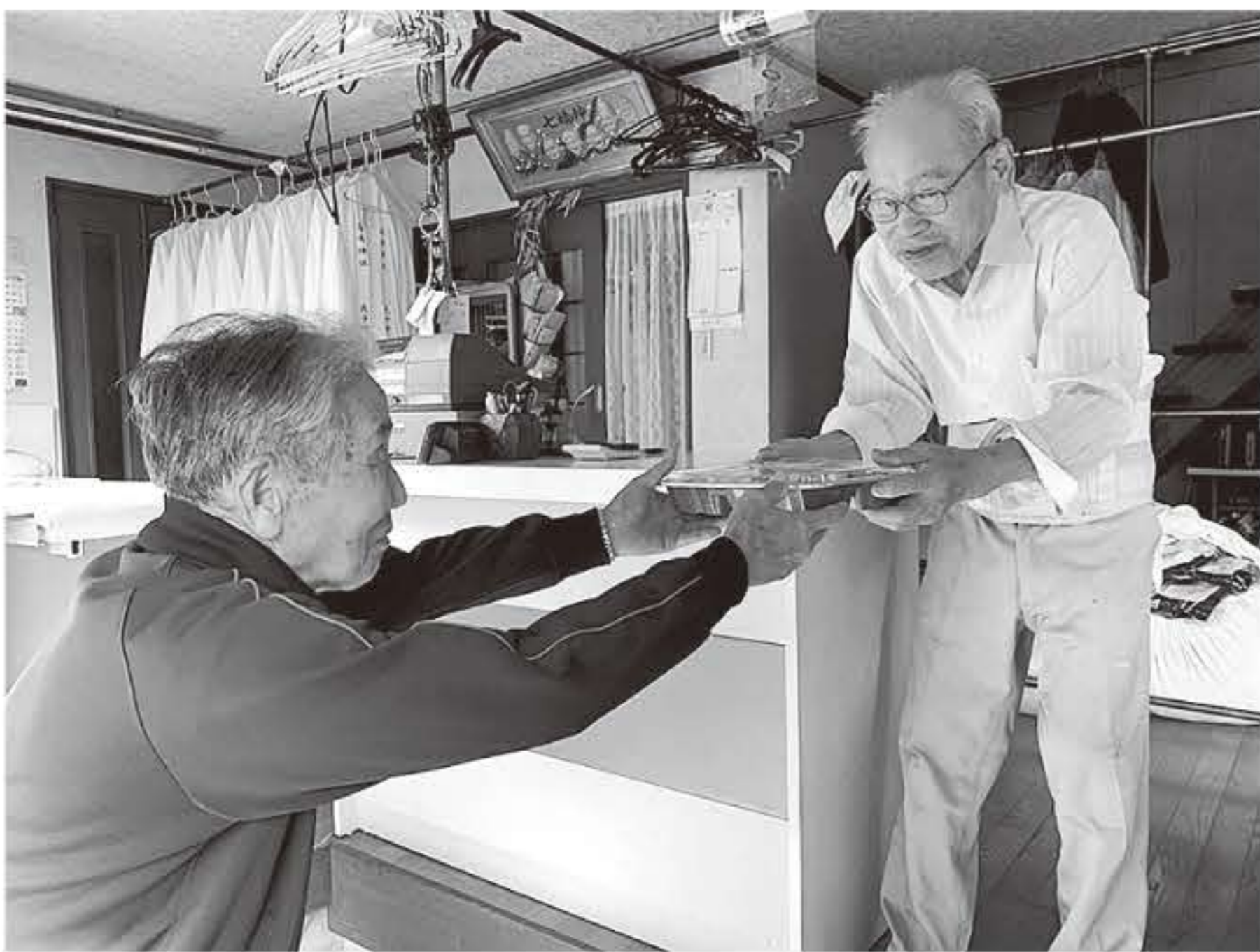
いきいきサロン(村岡区)