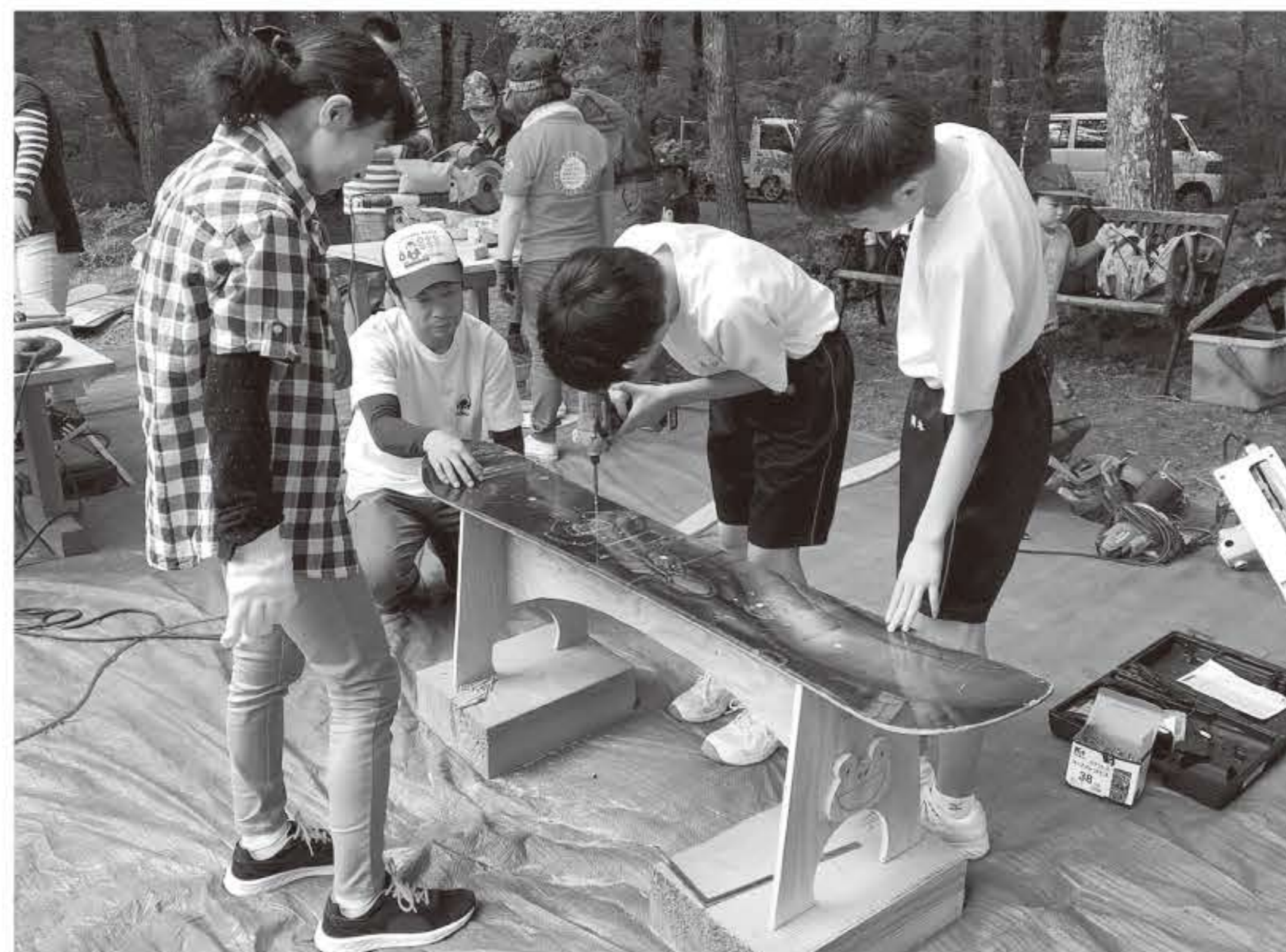
スノーボードベンチづくりボランティア