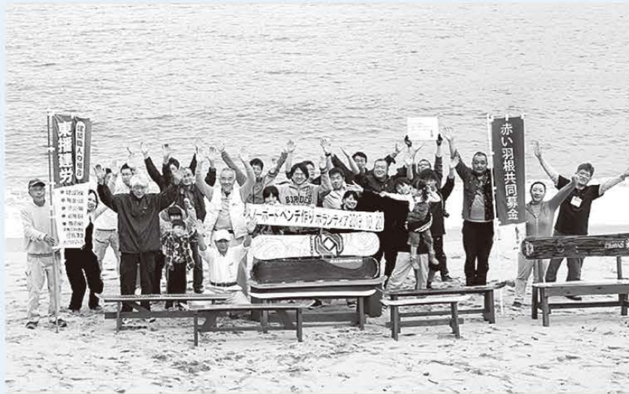
スノーボードベンチづくりボランティア