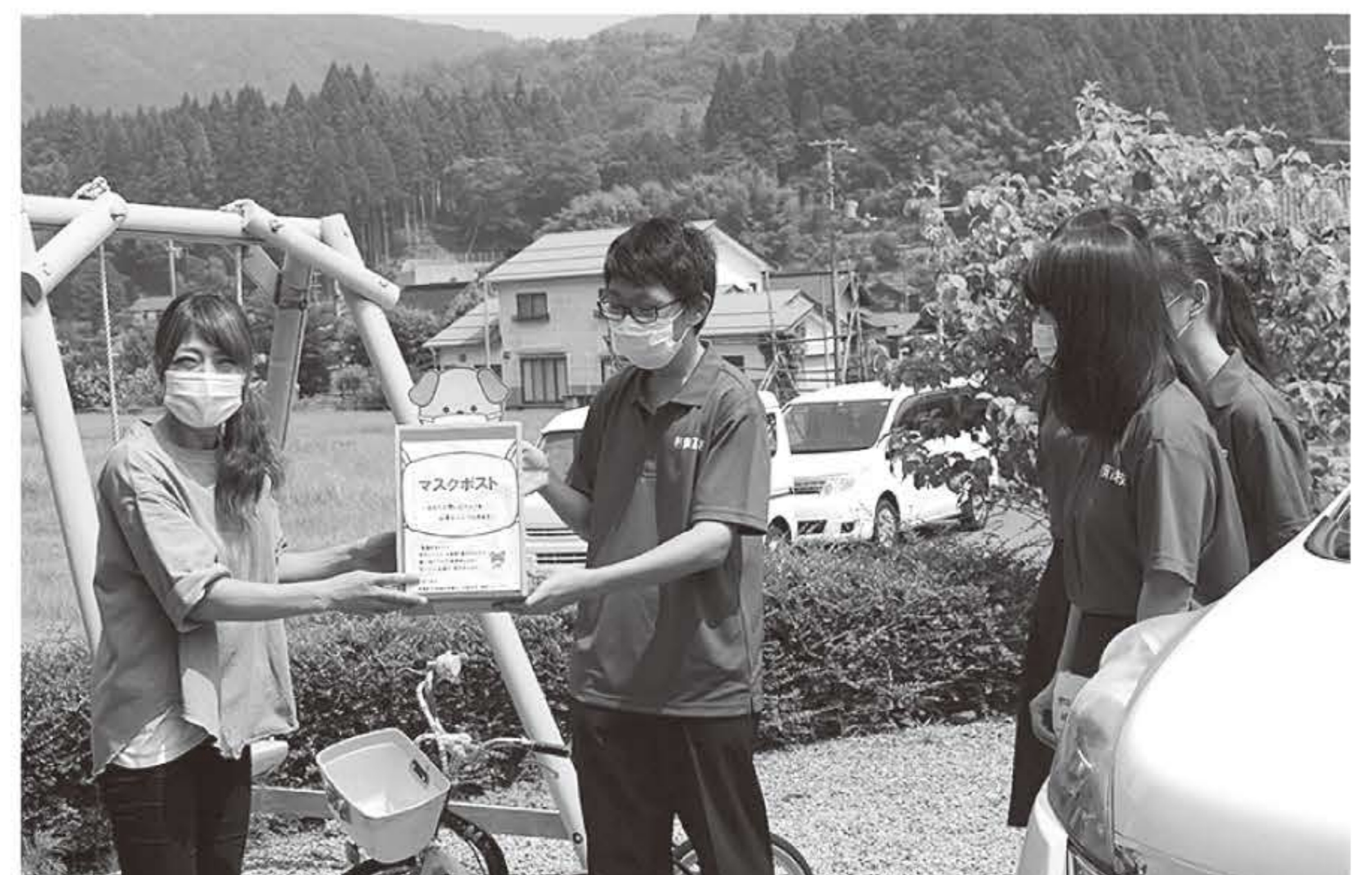
HAIR SALON hana